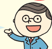
通販する蔵 担当者より お客様へのコメント

導入当初は、楽天、Yahoo!、Bidders のショッピングモールに対する注文情報、商品・在庫情報の一元管理のみを行い、通販する蔵として一般的な構成でシステムの導入を対応させて頂きました。 その後、通販する蔵導入による業務の効率化を実感頂き、リアル店舗の新規 OPEN に対して「POS する蔵」を導入！続いて自社サイト構築、リアル店舗 2 号店 OPEN という形で、今では全店舗の情報を通販する蔵で一元管理するところまで進化してきました。 今後もお客様の販売戦略に後れを取らないようにすることが弊社の使命だと感じています。